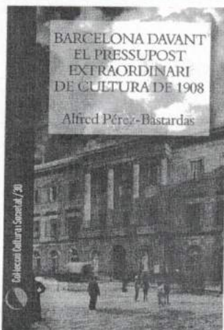
Barcelona davant el pressupost extraordinari de cultura de 1908 d'Alfred Pérez-Bastardas 271 pàgines · 12 euros

"La discussió que Barcelona va afrontar entorn del Pressupost no fou tan en termes pedagògics com polítics, i és clar, com que política vol dir pedagogia, el Pressupost de Cultura va esdevenir el camp on s'hi van ajuntar les noves voluntats i desitjos polítics. D'aquesta qüestió en depenia no tan sols l'autonomia municipal, sinó també la manera, l'esperit i el sentit de l'autonomia de Catalunya". Extracte de la introducció